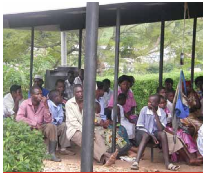
Wartende Patienten am Health Center in Nabwendo

Und für den neuen Krankenwagen für Namutamba sind inzwischen fast 35.000€ eingegangen, sodass die Bestellung jetzt getätigt werden kann. Danke wenn Sie uns helfen, den Rest aufzubringen! Wir rechnen mit ca. 50.000€. Spendenstichwort: „AUTO NAMUTAMBA“.